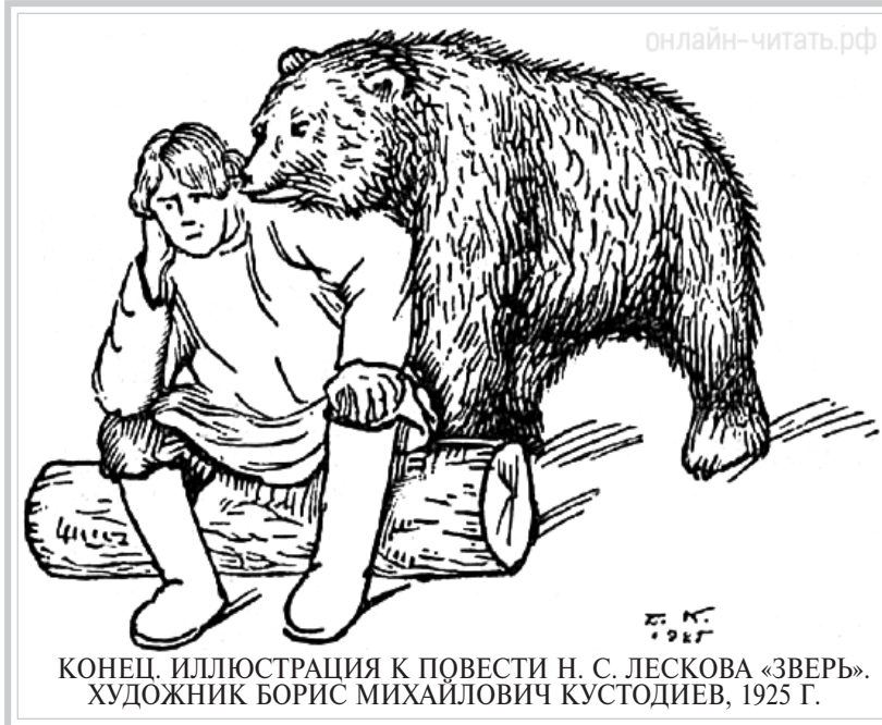
КОНЕЦ. ИЛЛЮСТРАЦИЯ К ПОВЕСТИ Н. С. ЛЕСКОВА «ЗВЕРЬ». ХУДОЖНИК БОРИС МИХАЙЛОВИЧ КУСТОДИЕВ, 1925 Г.