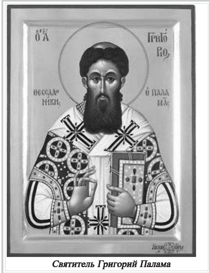
Святитель Григорий Палама

не выдерживая, разверзлись (разорвались). Прекрасно, следовательно, некто сказал Богу: «Ни небо не чисто пред Тобой» (Иов.15:15), называя «небом» - Ангелов, сущих на небе, Архангелов, многоочитых Херувимов, шестокрылатых Серафимов, все иное премирное естество. Следовательно, справедливо, что ни небо, т.е. сущие на нем Ангелы, не суть чистые пред Богом небес, потому что и со стороны высочайшей и владычней иерархии непрестанно очищаемые и озаряемые 565 , уступают более совершенной Чистоте. Только единое человеческое («кати-мас») естество во Христе, сущее богоипостасное и обоже- ственное, богато обладает совершеннейшей чистотой и способно вместить все сияние и светозарность, так сказать, и